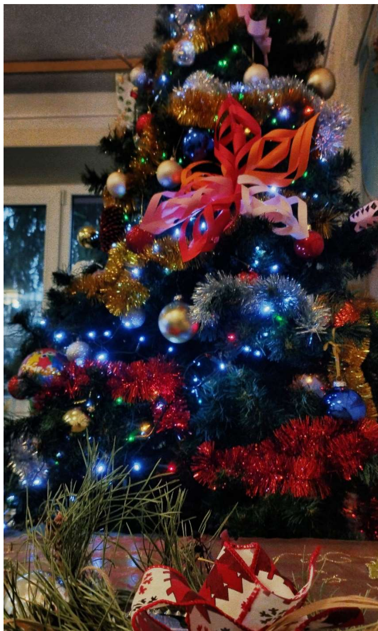
Choinka w WDpF

Wszystkiego co najpiękniejsze w Nowym 2025 Roku!